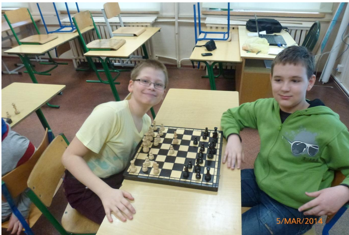
Szachy to wcale nie jest nudna gra!