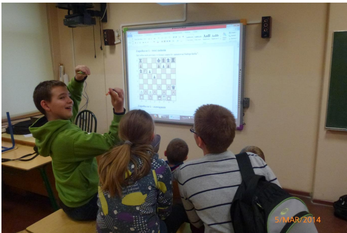
To ulubiona część zajęć, czyli zagadki szachowe☺